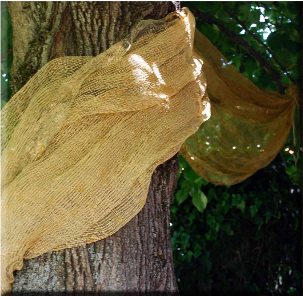
Autour de l'arbre