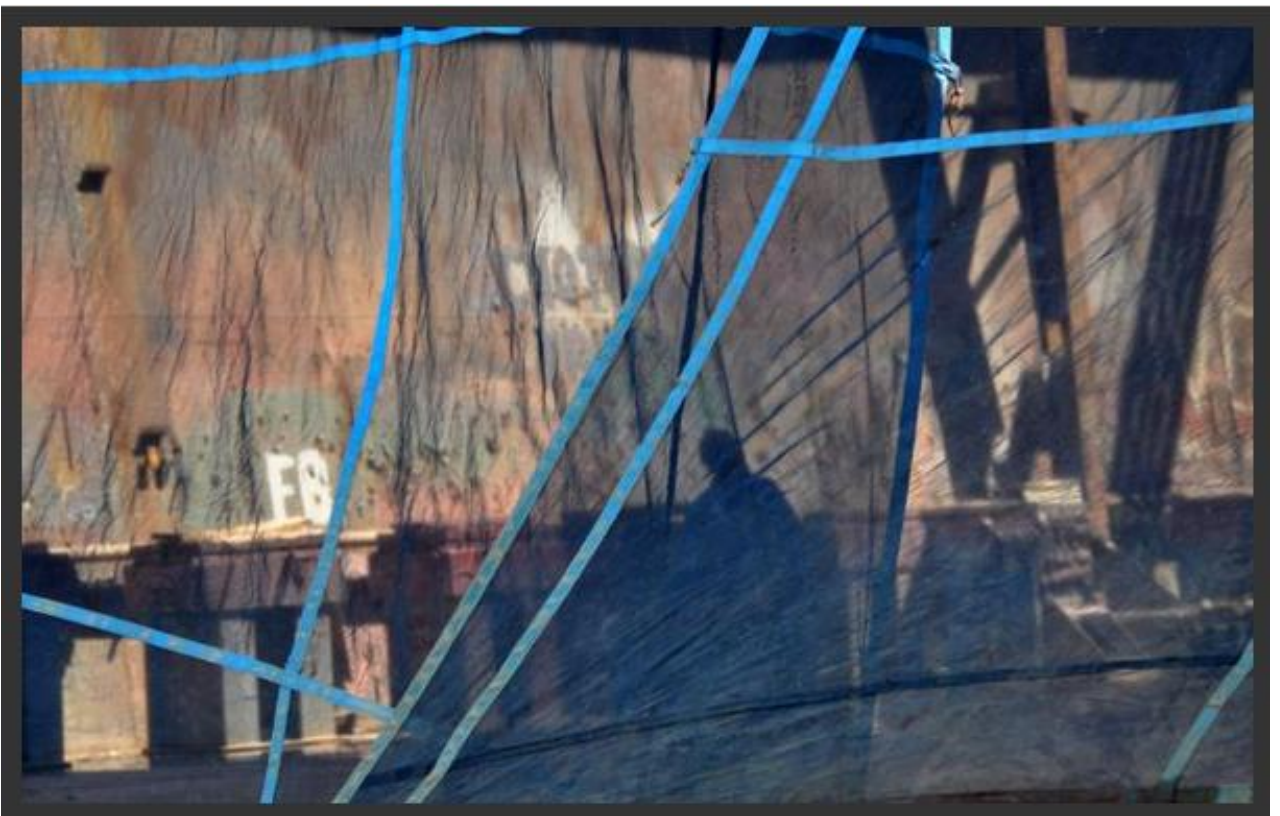
Port de Rotterdam – 2010 Le Voile Elévation