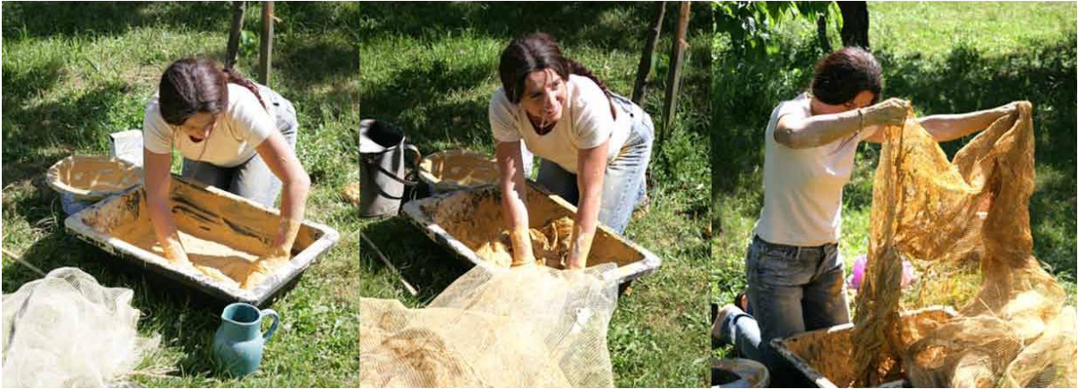
Le voile s'imprègne de terre