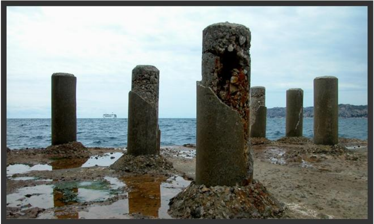
Port de Marseille – 2003 Au bout de la digue