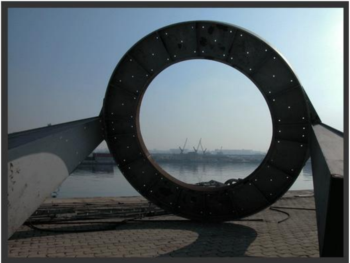
Port de Marseille – 2003 Cercle de grue et grues au fond